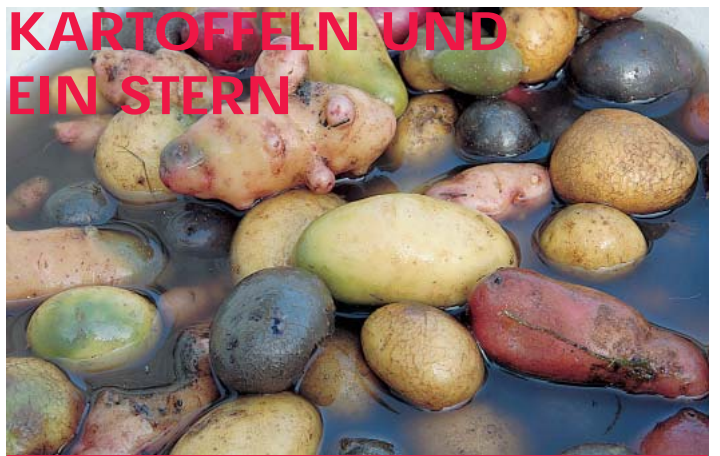
Ein Ausschnitt aus der letztjährigen Kartoffelernte im Vermehrungsgarten lässt die Vielfalt ahnen, die uns in der Supermarktwelt verloren gehen könnte.