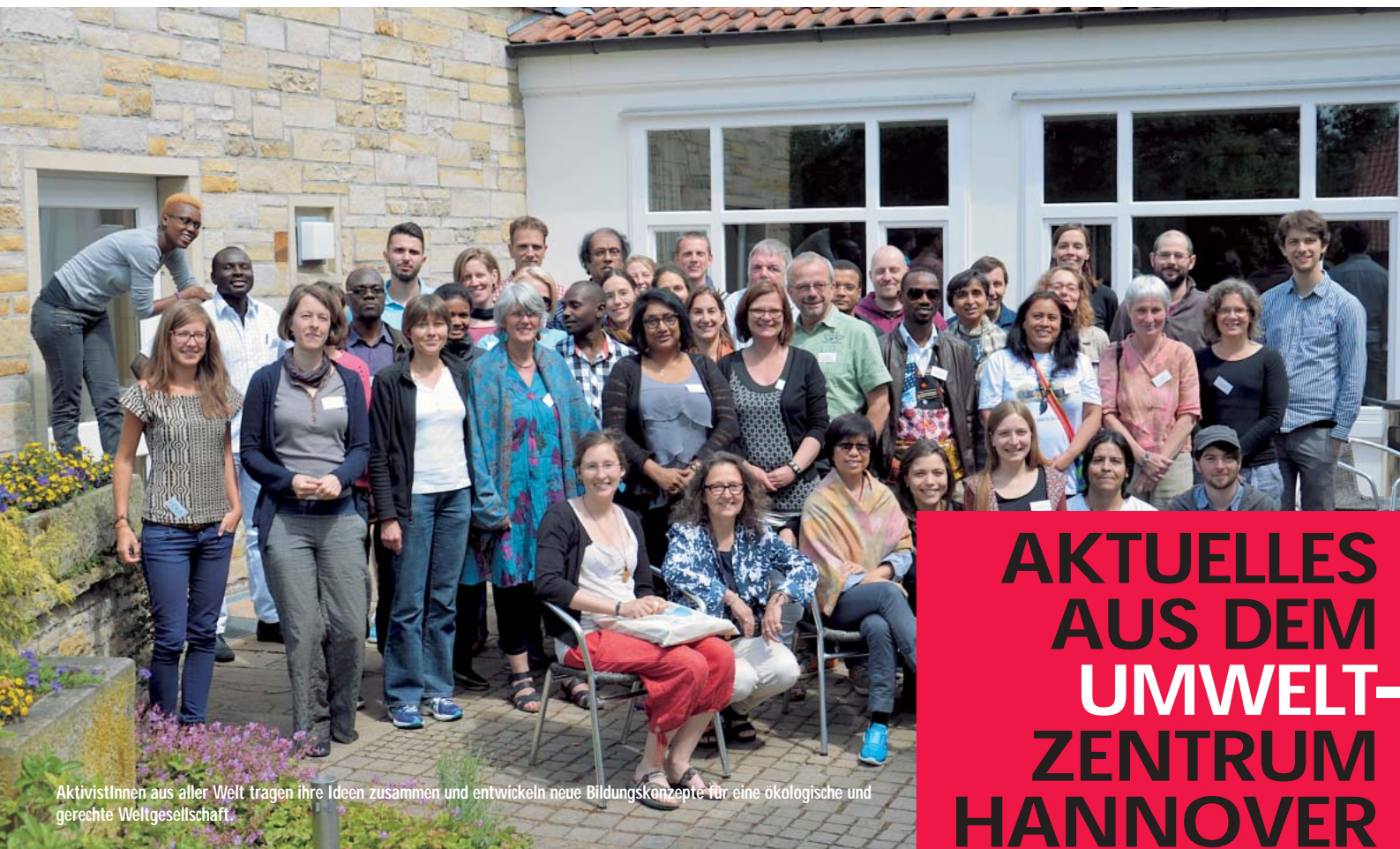
AktivistInnen aus aller Welt tragen ihre Ideen zusammen und entwickeln neue Bildungskonzepte für eine ökologische und gerechte Weltgesellschaft.